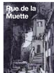
Rue de la Muette