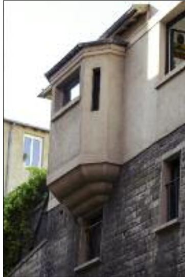
Rue JB Say