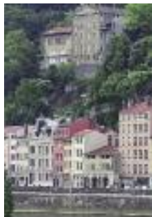
Rive droite de la Saône