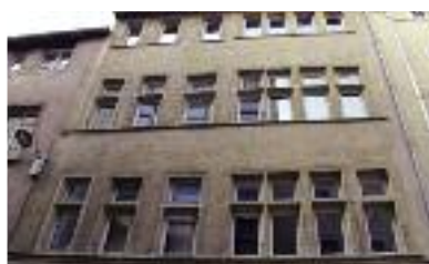
Meneaux rue de la Vieille