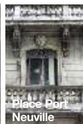
Place Port Neuville