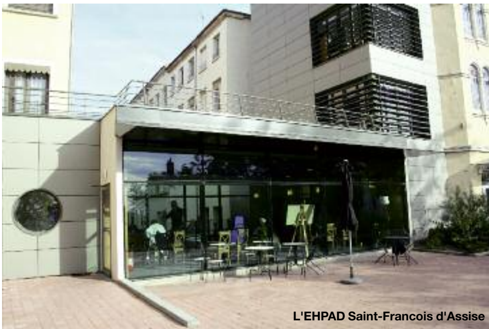
L'EHPAD Saint-François d'Assise