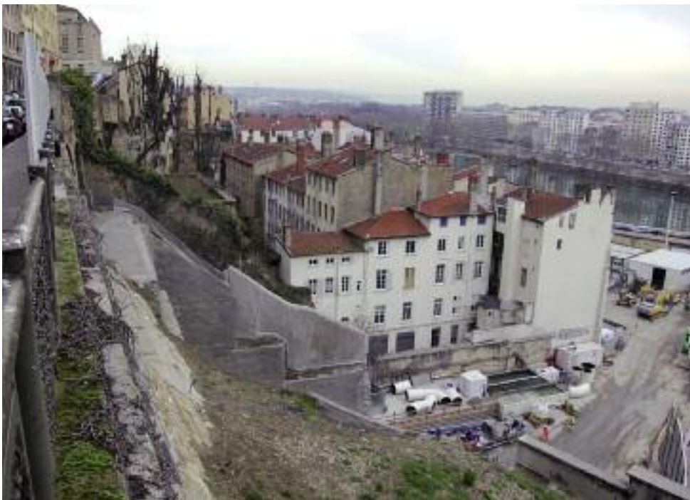
L'immeuble est situé contre le chantier

Quant aux fenêtres changées par le Grand Lyon, elles sont désormais voilées « tellement elles gonflaient pendant les tirs » et ont