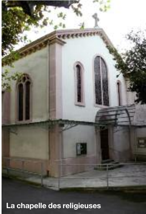
La chapelle des religieuses

Les sœurs rachètent le bâtiment de la Tour Pitrat en 1854, un an avant la mort d'Anne Rollet. Elles sont couramment appelées les sœurs de la Tour Pitrat. Elles comprennent rapidement que l'atelier de tissage ne réussira pas à les faire vivre, notamment après 1848 lorsque les révolutionnaires ont détruit une partie des métiers à tisser. Elles s'orientent alors vers l'enseignement primaire. C'est en 1856 que leur vocation hospitalière prend une ampleur inattendue. En mai 1856, le Rhône est monté dangereusement après de fortes pluies. Les digues lyon-