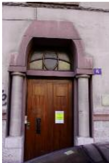
Rue st Fr Assise

Oculus – petite ouverture ronde dans un mur (œil de bœuf)