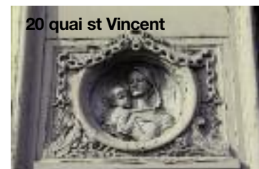
20 quai st Vincent