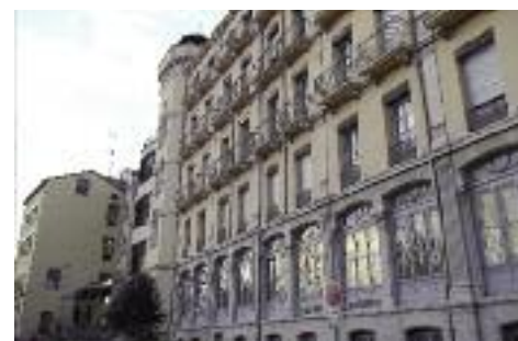
Le bâtiment de Saint-François d'Assise