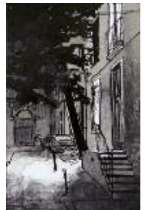
Rue de Crimée Rast- Maupas