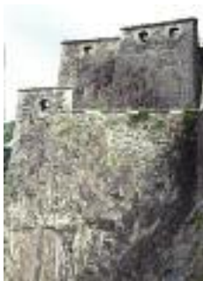
Fort St Jean