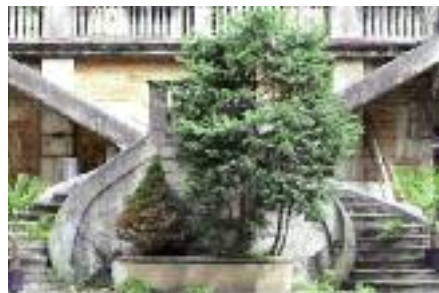
26 place port Neuville