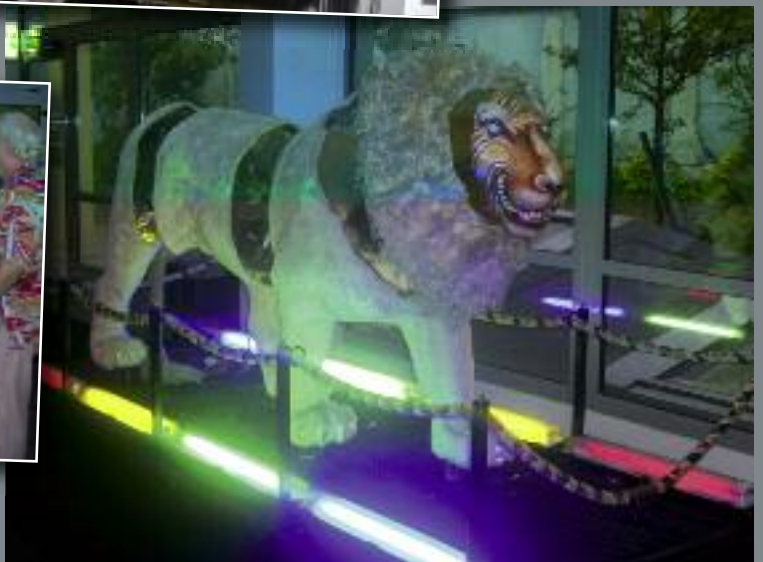
Espèce de Lion, de Claude Couffin