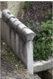
Amphithéâtre des 3 gaules