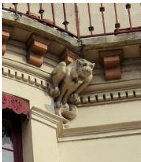
Boulevard de la Croix Rousse

• Sculpture de Geneviève Böhmer "la Fanny » bien cachée (La ficelle n° 14)