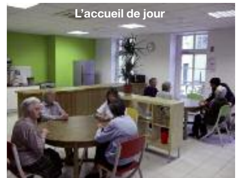
L'accueil de jour

en hôpital. L'hôpital Saint-François d'Assise est né. Il se développe jusqu'en 1977 où il devient une annexe de l'hôpital Saint-Joseph. Lorsque les établissements de Saint-Joseph et de Saint-Luc fusionnent et s'installent sur les quais du Rhône en 2002, l'hôpital croix-roussien est fermé, et les sœurs sont laissées seules dans le bâtiment vide après 146 ans de service. Elles ont depuis résisté à toutes les offres de rachat des promoteurs.