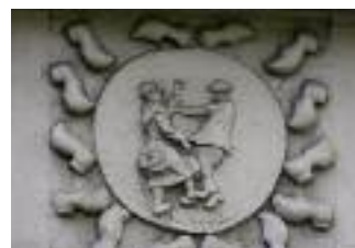
Rue de la poudrière

• Les Esses (montée de Serin). On aperçoit un bâtiment des anciennes usines Gillet (La ficelle n° 19)