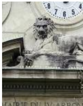
Mairie du 4e